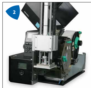
2 Kompakt, sicher und leichter Zugang für den Bediener.