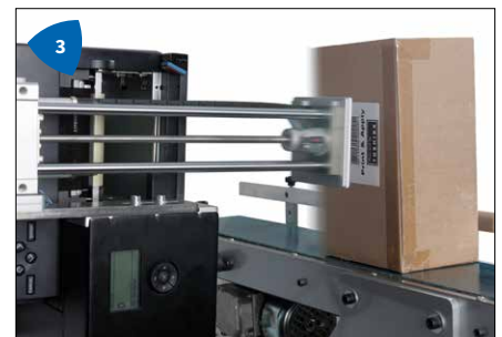
3 Vielseitiger Einsatz durch Aufbringen der Etiketten von oben, unten, seitlich und in beliebigen Winkeln.